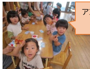
アンパンマンの旗を作ったよ！ (運動会の応援旗づくり)