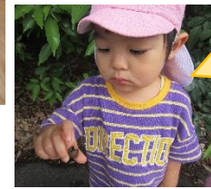
どんぐり、 みつけたよ！