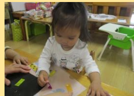
指先を使って上手にビニールテープを剥がせたよ