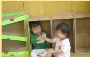
お友だちと手を合わせてタッチ！