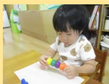
初めてのお絵描き：ブロックのようなクレヨンだったので、描くだけでなく繋げたり転がしたり食べようとしたり、使い方も様々でした