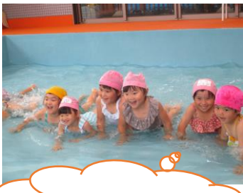
わにさんあるき、できるよ♪

夏といえばプール！子どもたちは「つめたーい！」「きもちーい！」など冷たい水に親しみながら楽しんでます。顔が濡れることが苦手な子もいるため、少しずつ水に慣れていけるようゲームを取り入れながら楽しく行っています。「できた！」と前回より顔つけが出来たことに喜びを味わう姿が見られたり、「がんばれー！」と友だちを応援する姿も見られ、子どもたちの優しさを感じるプールです。プールは今月で終了ですが、水遊びも含め夏ならではの遊びを全身で楽しんでいきたいと思ひます。